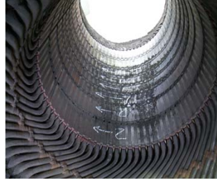
モーター内部点検、整備