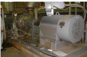
220kw 地熱発電還元ポンプ整備