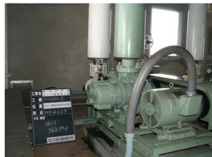
22kw 排水処理場ブロワの整備