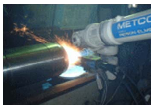
スマートアーク溶射加工・耐摩耗