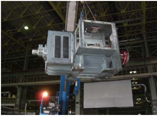
500kwプレスモーターの取外