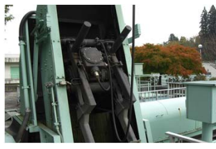
工水 処理場除塵機・減速機整備