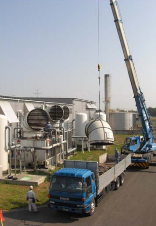
クーリングタワー用モーターの整備