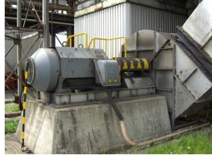
300kw集塵機モーターの取外