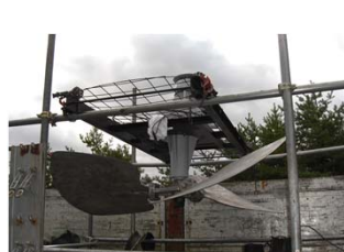
クーリングファンの整備