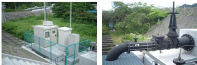
排水ポンプ場設置工事