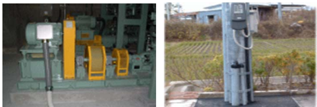
中継ポンプ場設置工事