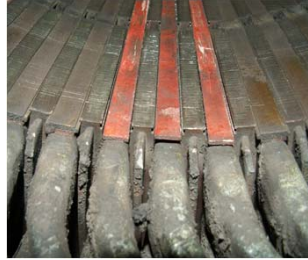
固定子内部の楔整備