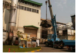
200kw排風機モーターの整備