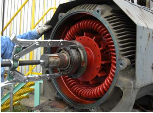
モーターの軸受け交換