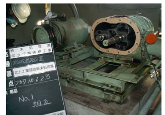
ブロワ内部の整備