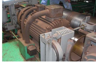
4.8t クレーンモーターの整備