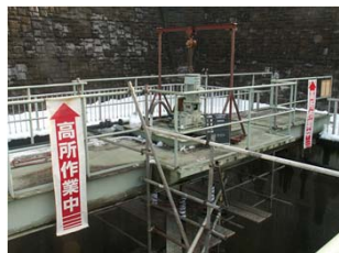
11kw 工水終末処理攪拌機整備