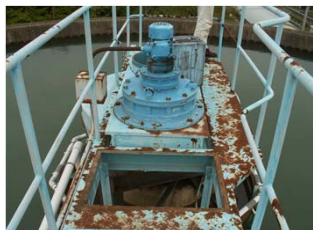
工水 沈澱池掻き寄せ機の交換