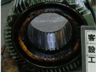
90kw 固定子コイルの巻替前